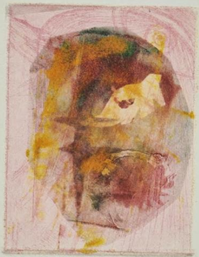
Cezanne monotype "Philosopher's Body"